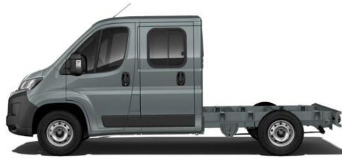
LANZAROTE GRAU Farbcode 385 350,00 (416,50)