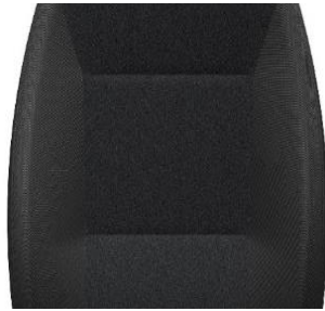
Standard Sitzbezug Schwarz