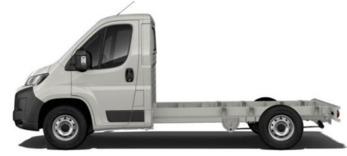
EXPEDITION GRAU Farbcode 676 350,00 (416,50)