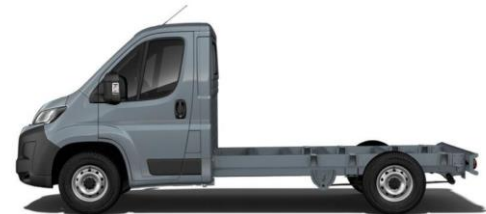
FER GRAU Farbcode 691 700,00 (833,00)