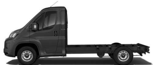
SCHWARZ Farbcode 632 700,00 (833,00)