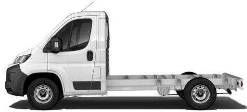
WEISS Farbcode 549 0,00 (0,00)