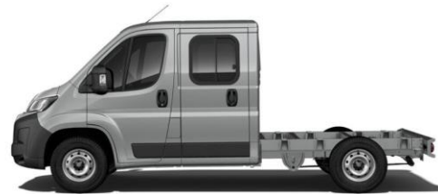
ARTENSE GRAU Farbcode 113 700,00 (833,00)